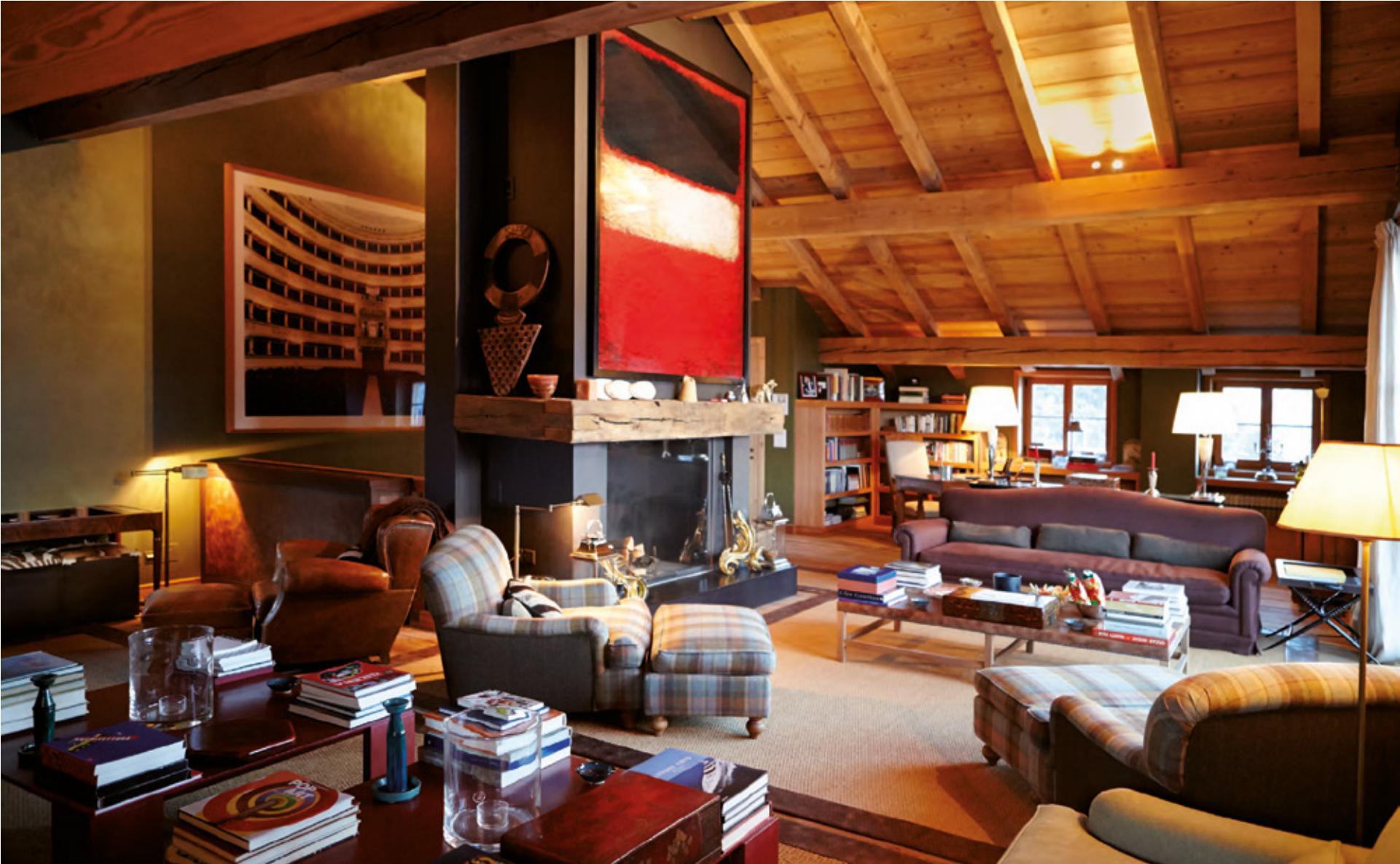
Appesa sopra il grande camino l'opera "Rothko" realizzata in pigmenti naturali dall'artista brasiliano Vik Muniz. I tavoli e i divani sono stati disegnati da Natalia Bianchi così come il camino in ferro.