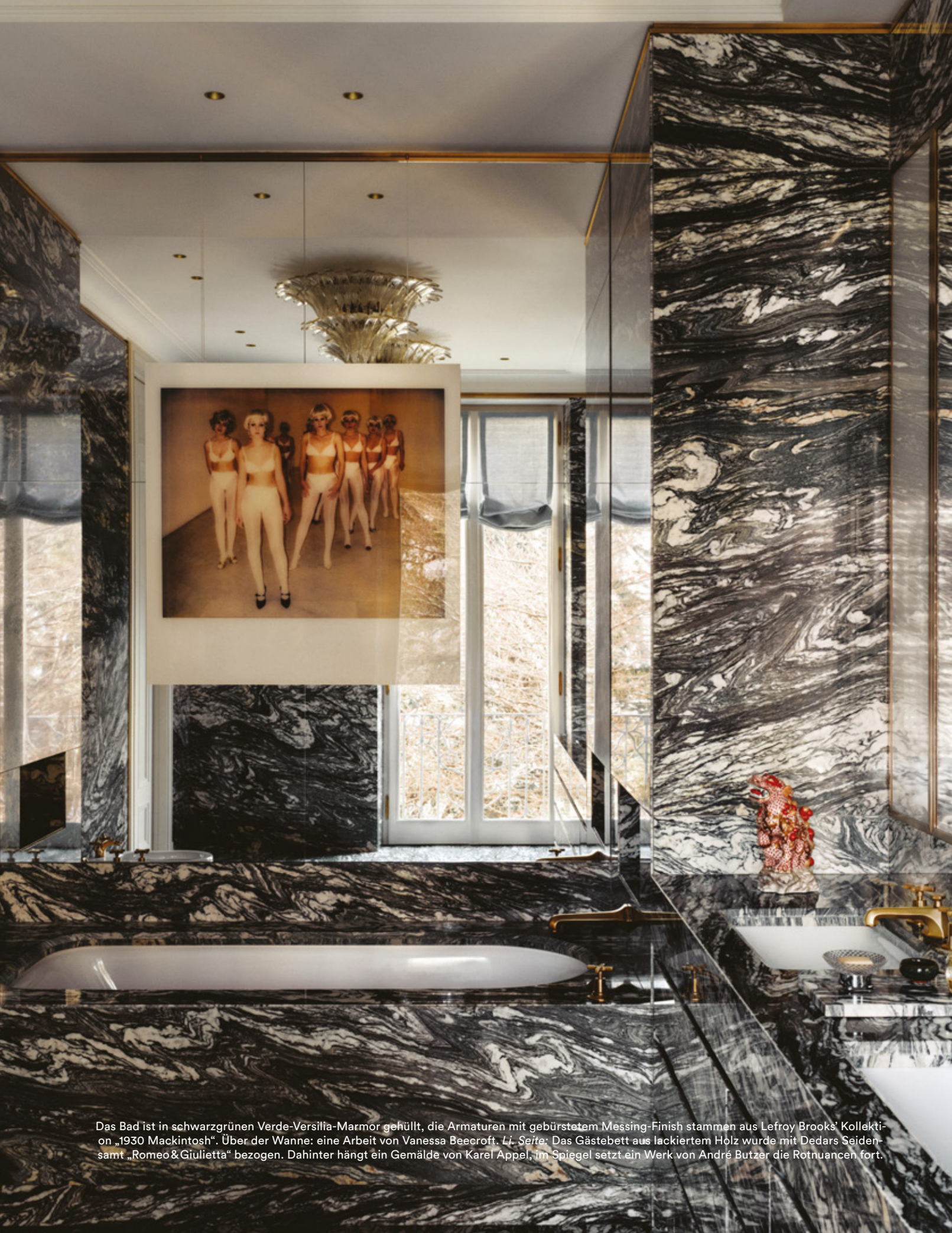
Das Bad ist in schwarzgrünen Verde-Versilia-Marmor gehüllt, die Armaturen mit gebürstetem Messing-Finish stammen aus Lefroy Brooks' Kollektion „1930 Mackintosh“. Über der Wanne: eine Arbeit von Vanessa Beecroft. Li. Seite: Das Gästebett aus lackiertem Holz wurde mit Dedars Seidensamt „Romeo&Giulietta“ bezogen. Dahinter hängt ein Gemälde von Karel Appel, im Spiegel setzt ein Werk von André Butzer die Rotnuancen fort.