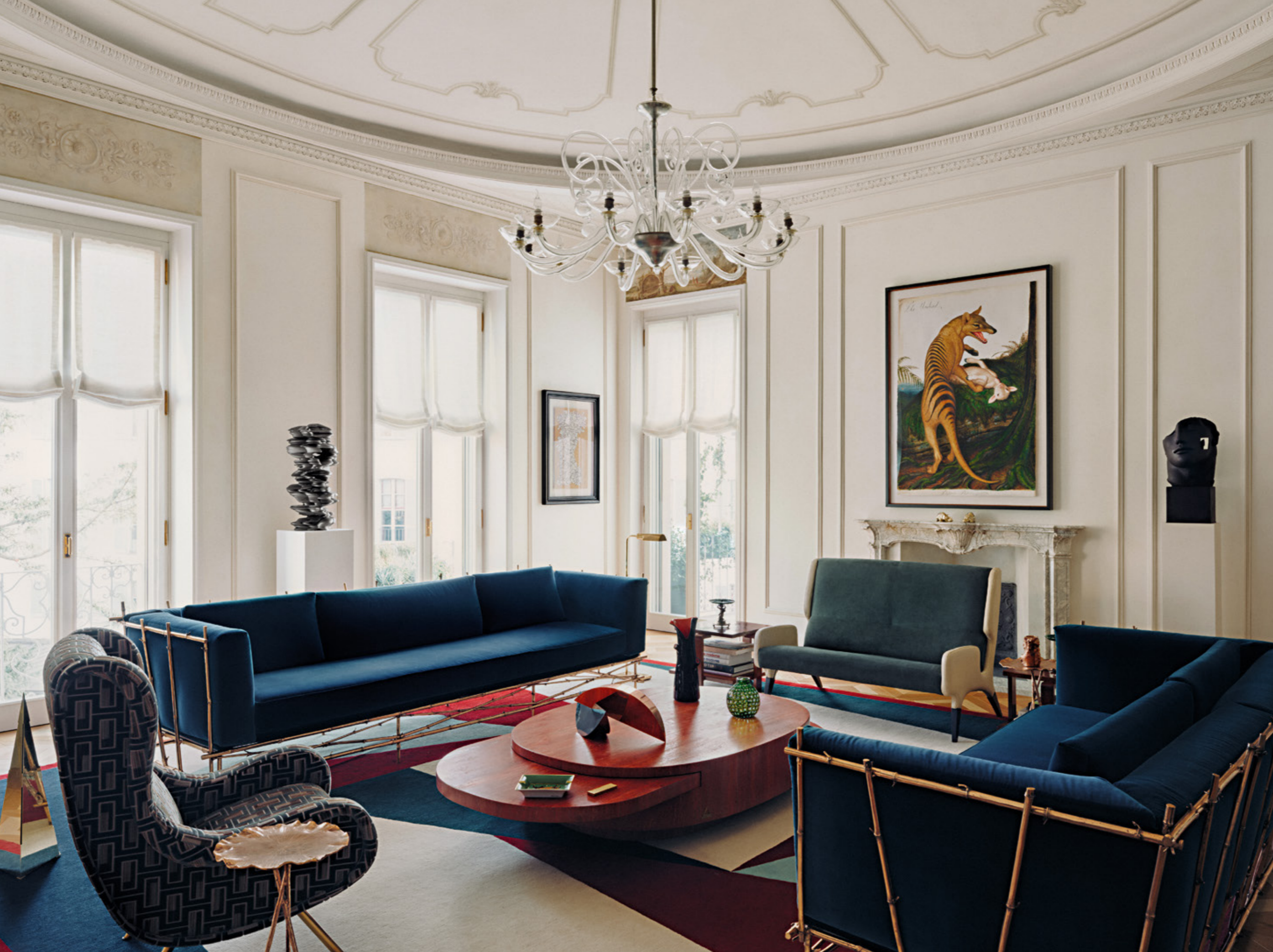
A SINISTRA Il living, con tappeto custom di Martino Gamper (Nilufar). Divano Bamboo e side table Fiore di Osanna Visconti. Divano verde di Gio Ponti. Poltrona Senior di Marco Zanuso (Arflex). Coffee table Ellisse di Gabriella Crespi. Sul camino opera di Walton Ford. Scultura di Tony Cragg.