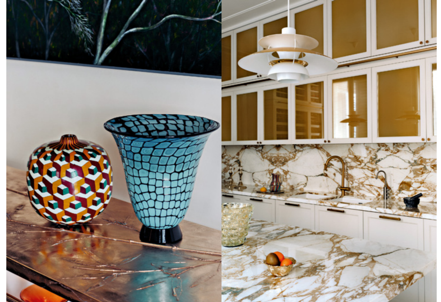
IN ALTO, DA SINISTRA Vaso Mosaico di Massimo Micheluzzi e vaso Neomurrini anni '70 circa di Barovier&Toso. Nella cucina, top e paraspruzzi in marmo Calacatta Oro. Pensili con ante in rete metallica di Syntarqui, montata su specchio e vetro chiaro. Lampadario a sospensione PH5 di Louis Poulsen.