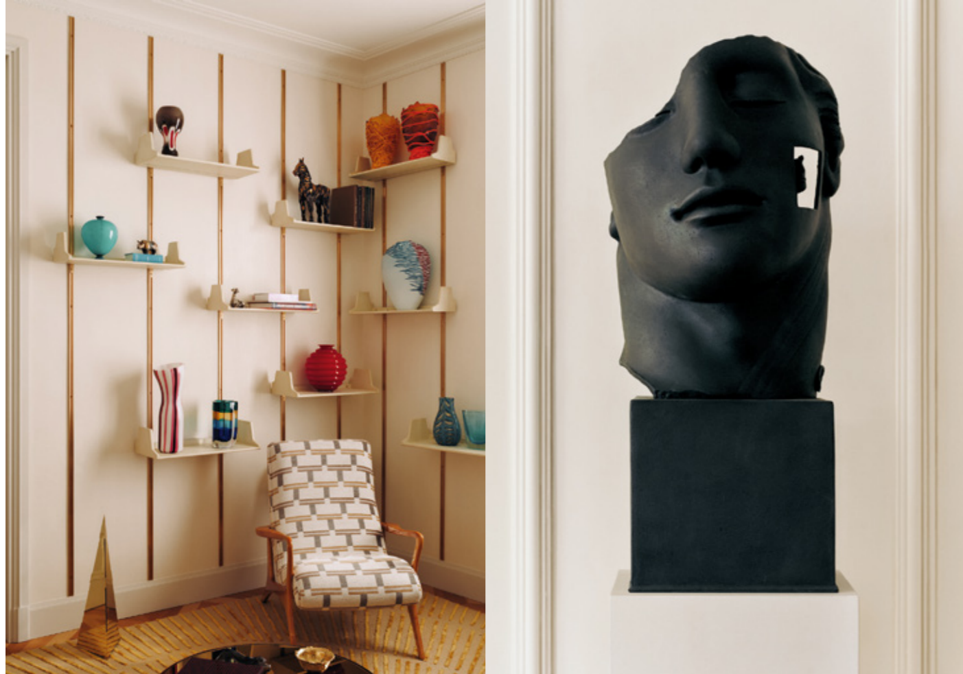
IN ALTO, DA SINISTRA Libreria ispirata a Osvaldo Borsani con montanti in ottone e ripiani in legno verniciato effetto pergamena (Andrea Galletti e Fabscarte). Tappeto Invisible Collection di Zenith Rug. Poltrona ispirata alla Contour Low Back Lounge Chair di Vladimir Kagan. Coffee table di FontanaArte. Pyramid Lamp di Gabriella Crespi. Scultura di Igor Mitoraj.